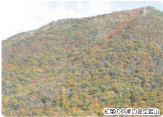
紅葉の時期の虚空蔵山