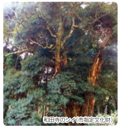
和田寺のシイ(市指定文化財)