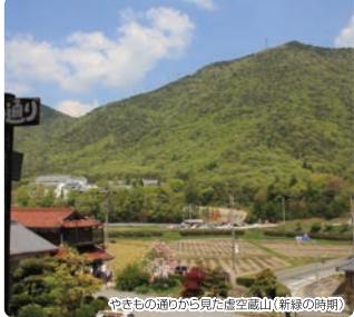
やきもの産みから見た虚空蔵山(新緑の時期)